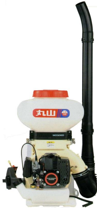
骨材散布機械 背負動力散布機