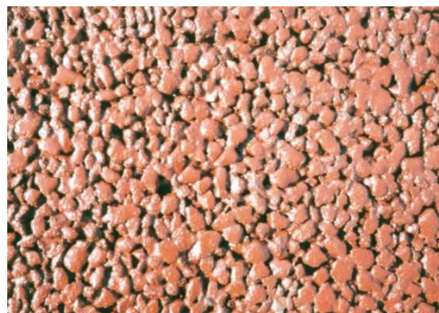
トップコート表面 (ベンガラ色)

排水性トップコート工法は、排水性舗装や透水性舗装（ポーラスアスファルト舗装）の表面に特殊な樹脂を散布し、皮膜を形成することにより、排水機能を損なうことなく、バインダーによる骨材間の結合力をさらに強化させ、摩耗や骨材飛散などに対する耐久性を向上させるものです。